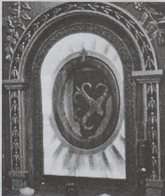
നൂറ്റാണ്ടുകൾക്ക് മുൻപ് മാട്ടേൽ തുരുത്തിൽ നിന്നും കണ്ടെടുക്കുകയും ഈ അടുത്തകാലത്ത് അർത്താരയ്ക്കടുത്ത് സ്ഥാപിച്ച സ്തുതിമണ്ഡപത്തിൽ പ്രതിഷ്ഠിക്കുകയും ചെയ്തിരിക്കുന്ന പൗരാണിക പള്ളിപ്പുറം കുരിശ്.

അരിവാൾ കൊണ്ട് കൊത്തിവെച്ചപ്പോൾ രക്തപ്രവാഹം ഉണ്ടായതുകണ്ട് ഭയന്ന്, വൻകരയിലെ ക്രൈസ്തവരെ അറിയിച്ചു. അവരിൽ ചിലർ ഭക്ത്യാദരപൂർണ്ണരും ഈ കുരിശെടുത്ത് കപ്പേളയിൽ പ്രതിഷ്ഠിച്ചു. ഇതറിഞ്ഞ് വളരെപ്പേർ കപ്പേളയിൽ വന്ന് കുരിശിനെ വണങ്ങിയിരുന്നു. പലർക്കും ദൈവാനുഗ്രഹം ലഭിക്കുന്നു എന്ന വാർത്ത പ്രസിദ്ധമായതോടെ വിശ്വാസികൾ കുരിശിൽ നിന്ന് പൊടി ചീകിയെടുത്ത് വീടുകളിൽ സൂക്ഷിച്ച് തുടങ്ങിയപ്പോഴാണ് ഈ കുരിശ് പള്ളിയിലെ വലതുവശത്തെ ചെറിയ അർത്താരയുടെ മുകളിലേക്ക് മാറ്റി സ്ഥാപിച്ചത്. മാധ്യമ പ്രചരണം വികസിച്ചിട്ടില്ലാത്ത അക്കാലത്ത്, അർഹിക്കുന്ന പരിഗണന ലഭിക്കാതെ അനേക നൂറ്റാ