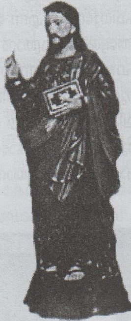
വലതുവശത്തെ ചെറിയ അൾത്താരയിൽ നിന്നെടുത്ത് പുതിയ സ്തുതിമണ്ഡപത്തിൽ സ്ഥാപിച്ചിരിക്കുന്ന വിശുദ്ധ തോമ്മാശ്ലീഹായുടെ ഒരു മഹനീയ രൂപം