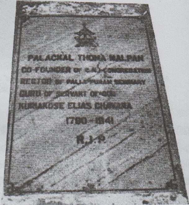
പള്ളിപ്പുറം പള്ളിയിലെ മദബഹായുടെ വലതുഭാഗത്ത് അടക്കം ചെയ്തിരിക്കുന്ന പാലയ്ക്കൽ തോമ്മാ മൽപ്പാനേയും ഇടതുഭാഗത്ത് അടക്കം ചെയ്തിരിക്കുന്ന വികാരി അപ്പസ്തോലിക്കായുടേയും കല്ലറകൾക്ക് മുകളിലെ ശിലാലിഖിതങ്ങൾ.

യ്ക്കൽ തോമ്മാമൽപ്പാനേതാണ്. ഈ പ്രാധാന്യങ്ങളൊക്കെ കണക്കിലെടുത്തുകൊണ്ടാണ് വത്തിക്കാന്റെ നിർദ്ദേശപ്രകാരം പരിശുദ്ധ മാർപാപ്പ പോൾ ആറാമന്റെ പ്രഥമ ഭാരത സന്ദർശനത്തിനുവേണ്ടി എയർ ഇൻഡ്യ തയ്യാറാക്കിയ ചിത്ര ശേഖരത്തിൽ പള്ളിപ്പുറം പള്ളിയുടെ പൗരാണിക ചിത്രം ഉൾപ്പെടുത്തിയിരുന്നത്.