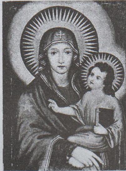
ക്രൈസ്തവ സഭാരംഭത്തിൽ യൂറോപ്പിൽ നിന്നും കൊണ്ടുവന്ന ദൈവജനനിയുടെ എണ്ണച്ചരയാചിത്രം.

മദ്രാസിലെ സെന്റ് തോമസ് മൗണ്ടിലാണ് പ്രതിഷ്ഠിച്ചിരിക്കുന്നതെന്നും, അതുകൊണ്ട് ഈ രണ്ട് ദേവാലയങ്ങളേയും ഭാരതത്തിലെ ഏറ്റവും പൗരാണിക മരിയൻ ദേവാലയങ്ങളായിട്ടാണ് അംഗീകരിക്കപ്പെട്ടിരിക്കുന്നത്.